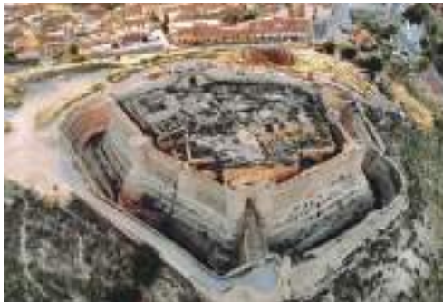
Muralla exterior del castillo de Chinchilla y foso

También visitaremos la iglesia de Santa María del Salvador, situada en la plaza principal. Aunque en la actualidad presenta un aspecto barroco, sus ini-