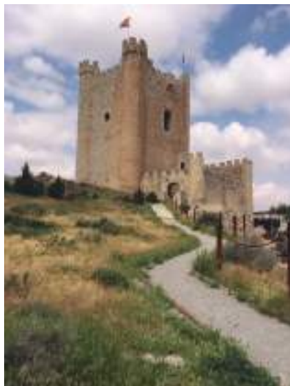
Castillo de Alcalá del Júcar

Merece la pena visitar alguna de las cuevas de la población, ahora convertidas en mesones, como por ejemplo la del Diablo.