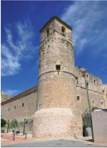
Torreón campanario y fachada norte del castillo de Garcimuñoz