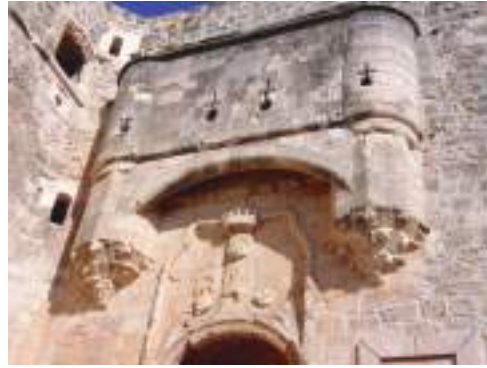
Puerta de entrada al castillo

tillo, el que construyó D. Juan Pacheco, hay otro, el que habitó el mal llamado Infante D. Juan Manuel. El castillo de D. Juan Pacheco tiene una de las portadas más bonitas de todos los castillos de España, similar a un retablo colgante que pende de una ladronera ciega. Es de estilo gótico isabelino. Es un castillo de transición al fuerte abaluartado para resistir, con sus fuertes torres cilíndricas, los embates de la artillería. Algunas de sus ventanas en forma de cruz y otros elementos, como la gran puerta de acceso al patio de armas, ya tienen un toque de estilo renacentista.