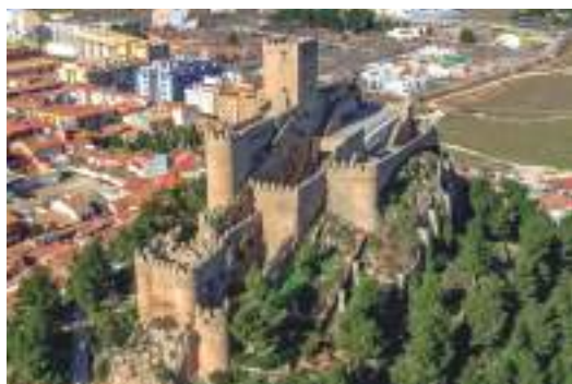
Castillo de Almansa

La silueta del castillo de Almansa se aprecia desde la autovía de Levante, con su imponente forma de barco. En los accesos al castillo hay una exposición de réplicas de máquinas de guerra medievales. El castillo todavía mantiene tres recintos. El castillo en sí, además de las murallas que lo protegían, constaba de dos torres gemelas, unidas en su parte superior por un pasadizo, pero en el terremoto del año 1755 cayó una de ellas. El castillo actual fue mandado construir por el marqués de Villena, D. Juan Pacheco, entre 1449 y 1454. Su planta es rectangular o de doble cuadrado, con una escalera de ojo abierto digna de contemplación. Con motivo de la sublevación del año 1476, fue conquistado por Gaspar Fabra para la Corona de Castilla.