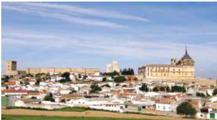
Muralla alta de Uclés y monasterio

Allí veremos las murallas en cremallera, de origen cristiano, el campo de batalla de la que se celebró en 1108 contra los almorávides y que supuso el inicio de la independencia del condado de Portugal, pues al morir el infante Sancho Alfonsoz y no tener el rey Alfonso VI otro heredero varón, su hija