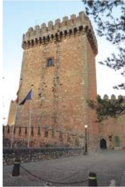
Torre del homenaje

Desde Castillo de Garcimuñoz tomamos la A3 para llegar a Alarcón , situado a tan solo 35 kilómetros. Antes de llegar a la población nos sale al paso su torre del Campo, levantada por D. Juan Manuel en el siglo XIV. Paramos allí para ver este complejo defensivo, con sus diversas murallas intermedias, que se conserva intacto y que actualmente es uno de los mejor conservados de Europa con su torre del Campo, torre de Enmedio, puerta del Bodegón, murallas circundantes y finalmente el castillo.