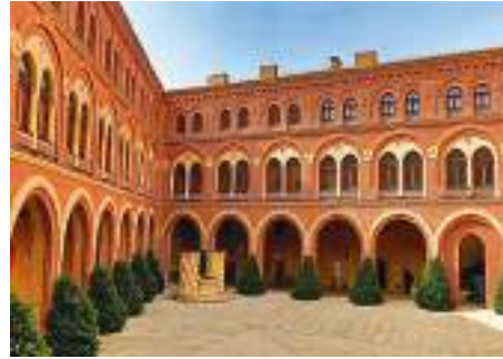
Patio de armas

mudéjar, recientemente restaurada en su esplendor original, con mocárabes similares a los de la Alhambra de Granada, los Reales Alcázares de Sevilla o el palacio de la Aljafería en Zaragoza. En dicha sala también existe un bestiario medieval de estilo gótico en las ventanas Noroeste y Suroeste, que es una singularidad de este castillo palacio. En este castillo se grabaron escenas de la película El Cid , El señor de los anillos y otras 20 películas más.