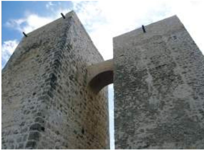
Torre del Pontido y del Palomar en Uclés

el interior como en el exterior, en él podremos contemplar los estilos plateresco, herreriano y churrigueresco, éste último en su fachada principal.