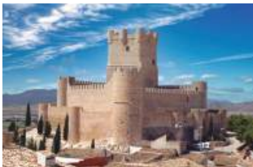
Castillo de Villena

El castillo de Villena se aprecia desde la autovía de Levante con su imponente torre del homenaje y las murallas que lo circundan. En la torre del homenaje, que consta de tres plantas, la primera es almohade con su bóveda de arcos entrecruzados, la segunda planta fue habitada por la infanta de Aragón, Constanza, desde 1306 hasta 1312, cuando fue entregada por su padre, el rey de Aragón Jaime II, al infante D. Juan Manuel, como futura esposa, pero como solo tenía 6 años de edad, debía permanecer en esta torre hasta que se celebrara el matrimonio. En esta visita también podemos ver una réplica del famoso tesoro de Villena, considerado como el segundo mejor de Europa de la Edad del Bronce.