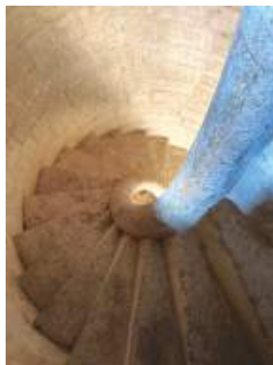
Escalera de caracol del castillo