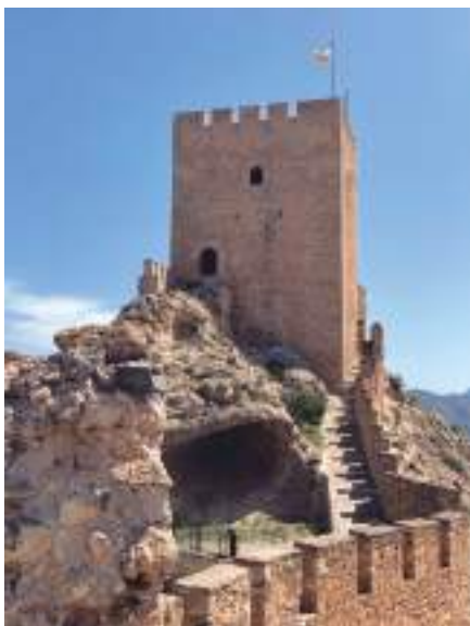
Torre del homenaje del castillo de Sax