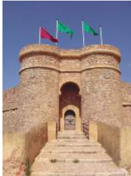
Puerta de acceso al castillo de Chinchilla

cios datan del siglo XIV. Las sucesivas reformas la han convertido en una amalgama de estilos: mudéjar, gótico, renacentista, barroco y neoclásico. Digna de contemplación es la capilla mayor con su magnífica concha de Santiago.